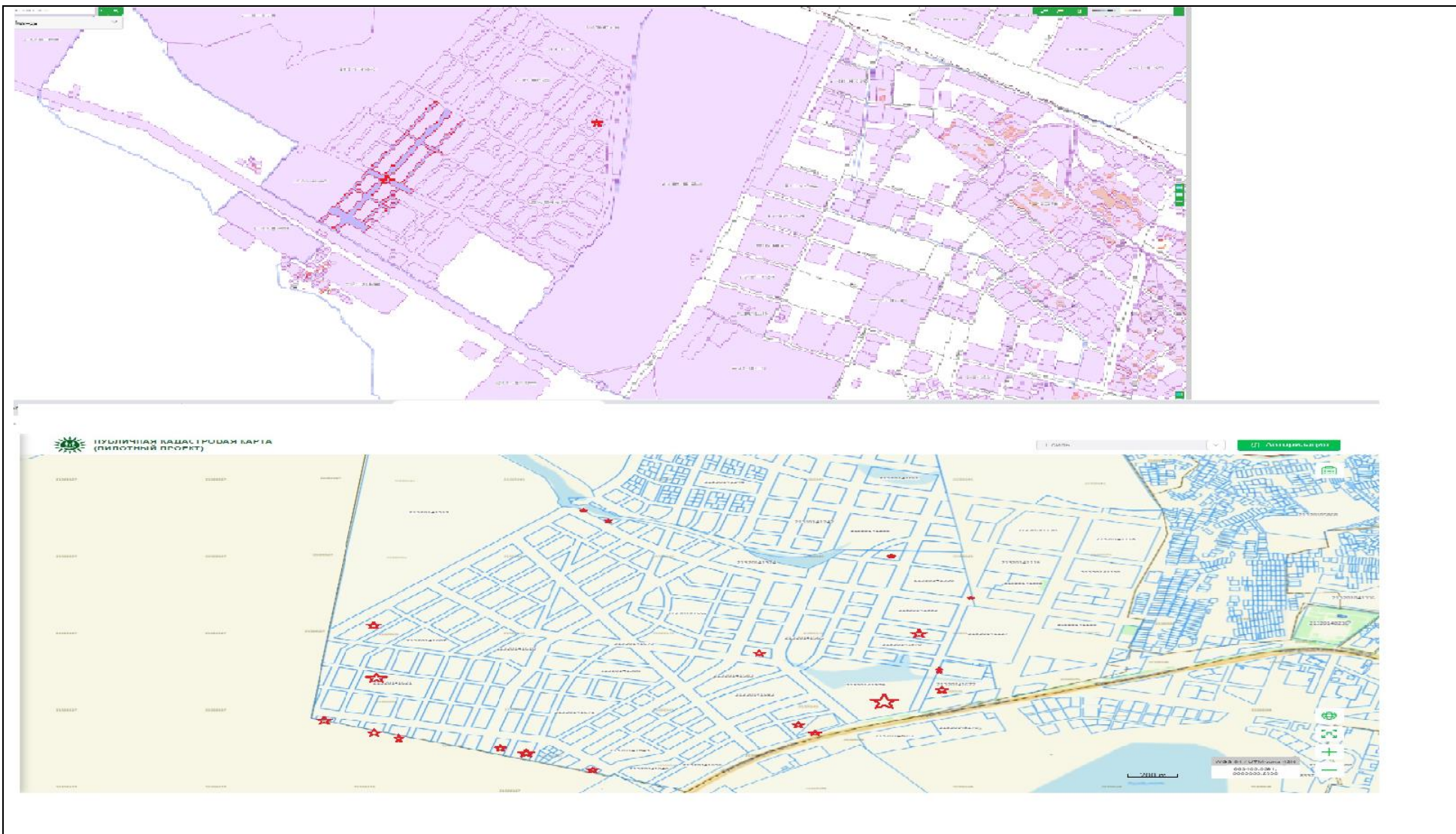
Схема расположения ЗУ в г. Астана район Есиль и район Сарыарка.